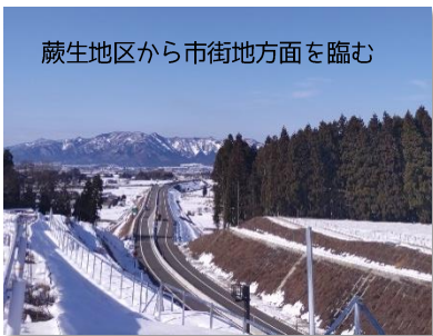
蕨生地区から市街地方面を臨む

急ピッチで進む中部縦貫自動車道の延伸工事。いよいよ大野 IC～九頭竜 IC までの完成が近づいてきました。秋には大野の街中から和泉地区まで約 20 分。グンと近くなりますね。